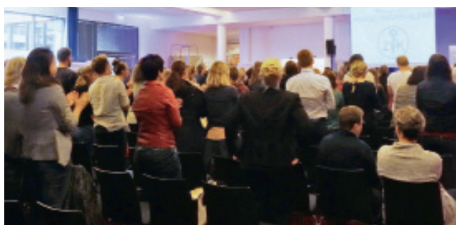
Große Resonanz: Archivbild des Kongresses aus dem Herbst des Jahres 2016

Bis zum 28. Februar 2018 um 24 Uhr können Physiotherapeutinnen und Physiotherapeuten ihre wissenschaftlichen Projekte für das Posterforum auf dem Kongress einreichen. Physiotherapie ist vielfältig und abwechslungsreich. Wie facettenreich unsere Tätigkeit ist, zeigt eine Posterausstellung - neben dem Hauptprogramm ei-